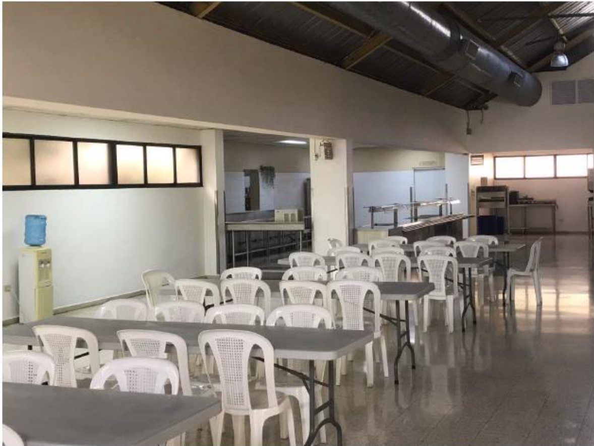
DINING ROOM FOR 120 ATHLETES